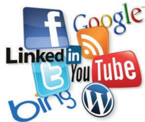
FIGURA 6. Redes sociales en clínica dental.

El marketing por correo electrónico puede servir para mantener el contacto con los pacientes actuales (fidelización) e informarles sobre novedades u ofertas o para captar nuevos pacientes a través de incentivos de valor 18 . Existen múltiples herramientas de email marketing que permiten segmentar a los pacientes, es decir, crear distintas listas (pacientes por provincias, por edad, por tratamientos...) con el objetivo de personalizar las comunicaciones. La elección más adecuada para el envío de comunicaciones por correo electrónico dependerá de los recursos disponibles de la clínica, de las funcionalidades requeridas y de la capacidad de integración con otras aplicaciones ya existentes en la clínica.