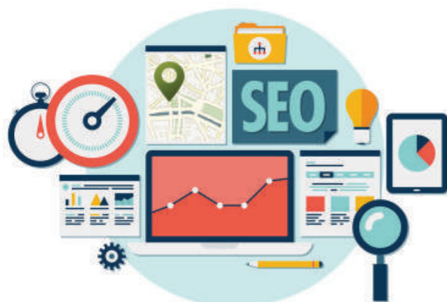
FIGURA 3. Posicionamiento SEO en clínica dental.

Además de posicionarse con el blog de contenidos se debe complementar dicha acción con otras técnicas de posicionamiento en buscadores. Para posicionar en Internet una web dental, se puede realizar de dos maneras: a través de la optimización natural en buscadores, llamado en inglés SEO ( Search Engine Optimization ) o a través de pago por anuncios: SEM ( Search Engine Marketing ).