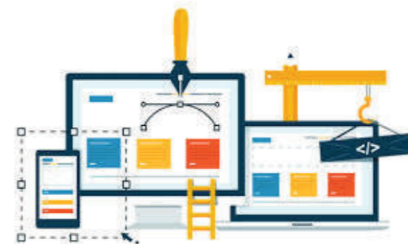
FIGURA 2. Página web en clínica dental.

Registrar un dominio es un proceso muy sencillo. Lo único que se tiene que hacer es dirigirse hacia un agente registrador acreditado español o extranjero, seleccionar un nombre de dominio que esté libre y registrar el dominio con la información de la persona física o jurídica. En el caso de dominios territoriales, cada país adopta sus propias pautas. Por ejemplo, si la clínica dental está en España, se puede acceder a la página oficial del Gobierno "dominios.es" en donde se encuentran los agentes registradores españoles 9 y comprobar si un dominio está disponible.