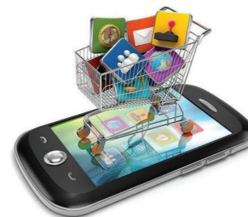
FIGURA 4. Marketing móvil en clínica dental.

Por tanto, una página web receptora del anuncio debe cumplir con ciertos parámetros (rapidez, diseño, optimización...) para que el anuncio sea eficiente. Aunque los resultados SEM son inmediatos, lo aconsejable es invertir en distintas estrategias combinadas (sitio web, blog, SEO, SEM, social media, email-marketing...) para alcanzar resultados constantes en el tiempo y no ser dependientes en exclusiva de los anuncios online.