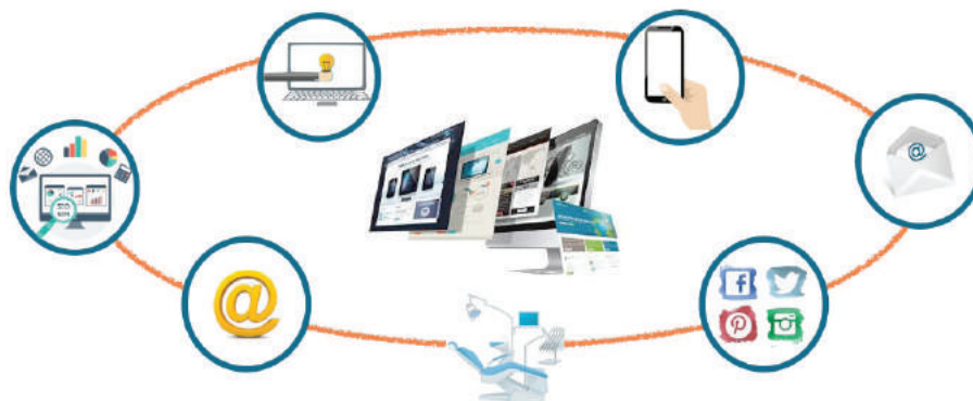
FIGURA 1. Marketing digital en clínica dental.

KEY WORDS: digital marketing, dental clinics, patient satisfaction, patient loyalty.